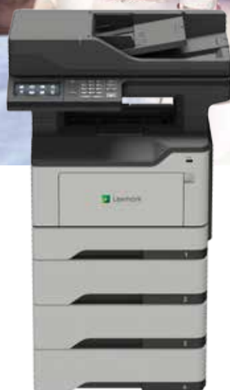
MB2546adwe с опционални тави